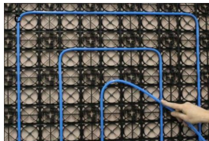
Sichere Putzverankerung durch Wabenelemente