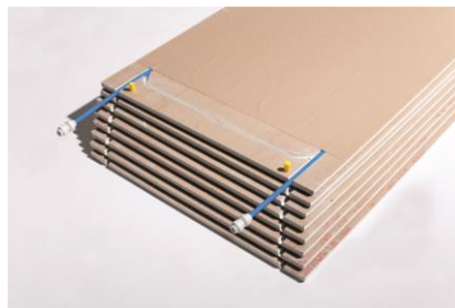
Installation über Steckkupplungen