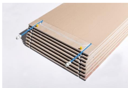
Installation über Steckkupplungen